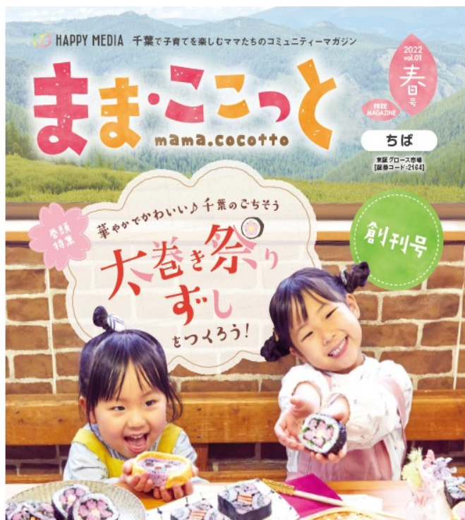
ママココット®創刊号